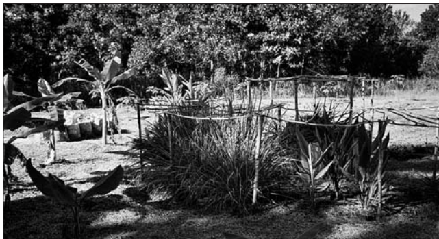
Jeder entscheidet selbst über die Vielseitigkeit seines Hausgartens