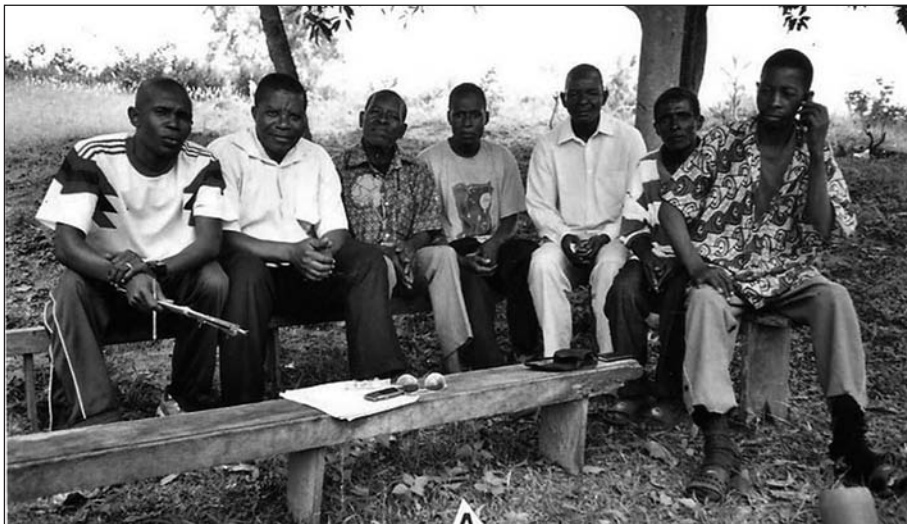
Das Team in Kingantoko