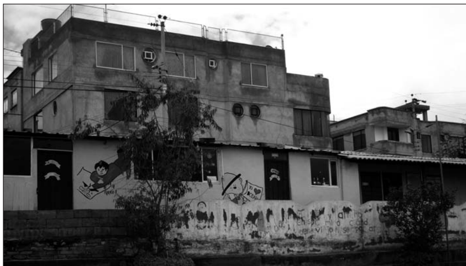
Schulpavillon mit Wasserschäden im Projekt Ceaby

HelferInnen. Näheres ist im SD-Büro zu erfahren.