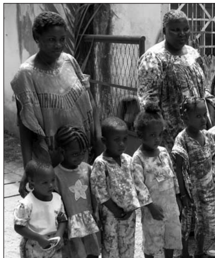
Kindermodenschau in Mariwal