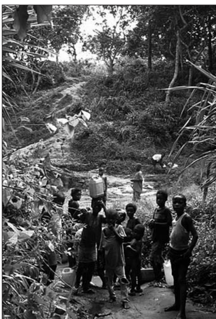
Dorfbewohner beim täglichen Gang zu den Quellen

begann ich in einer mittelständischen Firma für Brunnenbau zu arbeiten. Durch das neue Arbeitsum-