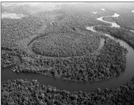
Blick auf den Subdistrikt Bukit Batu

Die dort lebenden Menschen wissen nicht, wie sie die kargen Böden ohne teure Kunstdünger, Pestizide und Herbizide nutzen können. Die einheimischen Dayaks haben traditionell als Jäger und Sammler vom Wald und von den Flüssen gelebt. Beginnend in den 70er Jahren sind nach Zentral-Kalimantan Indonesier aus