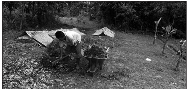
Mulch für den sandigen Boden