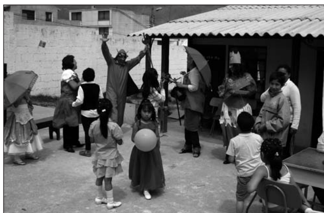
Fiestas de Quito bei CEABY am 6. Dezember 2010

Die Casa Emmi Pikler wuchs langsam und stetig, verschiedene Personen haben unser Projekt in Deutschland betreut. 2006 waren wir dann soweit, über die Differenzierung der monatlichen Beiträge der Eltern, selbst Familien zu unterstützen, in den Spielräumen, aber auch in Krippe und Kindergarten. Bislang