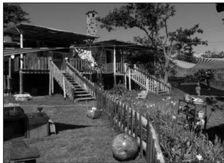
Das neue Haus der Casa Emmi Pikler