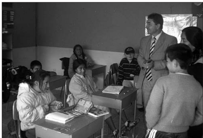
Der Sekretär vom Vizepräsidenten besucht die Schule in Otavalo