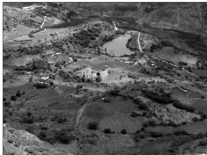
Vermessene Flächen von Futadi

Susila Dharma hat von 2004 bis 2008 das Projekt FUTADI in seinem Vorhaben unterstützt, eine gerechte Kostenverteilung für das Management und den Erhalt des Bewässerungssystems „Canal nuevo de El Tablón“ zu realisieren. El Tablón liegt im Süden Ecuadors. 300 Bauernfamilien wurde bei der Erstellung eines korrekten Plankatasters geholfen, um gerechte Wassergeldzahlungen für die Aufrechterhaltung der Bewässerungswirtschaft zu ermöglichen. FUTADI übertrug die per GPS erhobenen Daten in ein bereits vorhandenes Geoinformationssystem (GIS) vor Ort und aktualisierte mit den Flächenberechnungen die Zahlungsrolle. Es wurden Übersichtspläne zu den Bewässerungseinrichtungen, den Eigentums Grenzen mit bewässerten, bewässerbaren und für die Bewässerung ungeeigneten Flächen erstellt. Jeder Nutzer des Bewässerungssystems erhielt einen Plan von seiner oder seinen Parzellen. Mit diesen Grundlagen sollten Gesamtentscheidungen für eine nachhaltige Landwirtschaft ermöglicht werden.