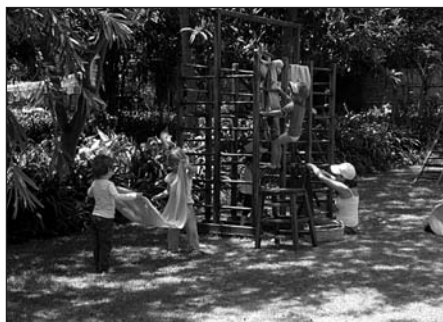
Der neue Garten des Projektes

haben wir es mit Mühe geschafft, dieses Prinzip aufrecht zu halten, es wird aber immer schwieriger, ein Gleichgewicht zu finden. Wie sollen wir angemessene Löhne zahlen und allen rechtlichen und finanziellen Anforderungen gerecht werden, ohne dabei unsere Philosophie umfassender Integration aufzugeben? Erziehungs- und Sozialministerium stellen zunehmend höhere Ansprüche, bieten aber keinerlei Unterstützung an. Unsere Erklärungen, dass wir den monatlichen Beitrag je nach den Möglichkeiten der Familien staffeln, deshalb aber den finanzstarken Familien ein höheres Schulgeld berechnen müssen, stoßen in den Ministerien bislang auf absolutes Unverständnis. Dahinter steht eine lange gesellschaftliche Tradition. Sicher würde für viele Ecuadorianer die einkommensunabhängige Betreuung aller Kinder eine eindeutige Abgrenzung erschweren und damit die Bedrohung geliebter Privilegien darstellen. Das wird mir immer wieder bewusst, wenn die erste abschätzende Frage beim Kennenlernen, z.B. auf Festen, lautet: „Auf welche Schule gehen denn deine Kinder?“