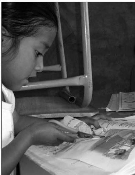
In Otavalo wird die Lernsituation auf die Bedürfnisse der Kinder ausgerichtet

bis keine staatlich gesicherte schulische Versorgung gab es nahezu keine Möglichkeiten für diese Kinder, sich an einem Ort einzufinden, wo sie sich ihrer Behinderung entsprechend entwickeln und bilden können.