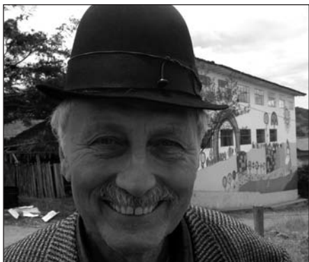
Dag vor der Schule in Ilincho, Saraguro