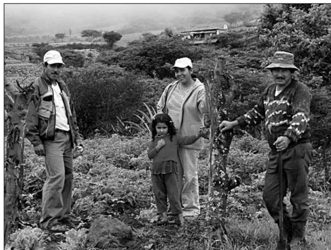
400 Familien betreiben auf 1.000 ha Landwirtschaft

Laut Gesetz gehören die Minen dem Staat, auch solche, die noch nicht entdeckt sind. Stets bestanden für die Zone von El Tablón Spekulationen zu irgendeiner ertragreichen Ausbeute, die sich in einer flächendeckenden Vergabe von Konzessionen für die Exploration, jedoch bislang geringfügig in der Ausbeute durch die gegenwärtige Wirtschaft widerspiegeln. Diese Konzessionen wurden vom Staat zurückgenommen. Eine erneute Vergabe ist nicht auszuschließen und wir interessieren staatliche Stellen gegenwärtig dafür, große Teile der Landschaft unter Schutz zu stellen. Eindrucksvolle geologische Formationen und architektonische Reste aus vorspanischer Zeit, die der Goldverarbeitung dienten, nebst der Präsenz von drei Klimazonen über die kurze Strecke von 15 km, machen den insgesamt einzigartigen Landschaftscharakter aus. Wir meinen, dass dies das beste Mittel ist, Zerstörung durch Minengesellschaften zumindest für diesen Raum aufhalten zu können. Schließlich wurde der Bau des Bewässerungskanals, mit dem rund 1000 ha bewirtschaftet werden, mit Mitteln der BID (Banco Internacional de Desarrollo) erreicht. Warum sollte dies alles wieder zunichte gemacht werden? Über 400 Familien betreiben hier Landwirtschaft, wenn natürlich auch mit einfachsten Methoden, da es nach wie vor an Kapital fehlt.